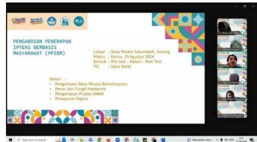
Gambar 1. Tahap Persiapan (Koordinasi dengan Kepala Desa)

berkelanjutan, strategi promosi melalui media sosial, serta daya saing produk UMKM lokal yang masih rendah. Pada tahap ini juga ketua tim pengabdian memperkenalkan tim pengabdian dan narasumber yang akan memberikan materi dan pelatihan selama kegiatan pengabdian. Tim pengabdian juga melakukan diskusi dengan kepala desa tentang jadwal dan tempat untuk pelatihan.