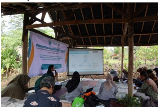
Gambar 2. Pemaparan Materi oleh Narasumber Pertama

masyarakat, dan ketidakstabilan ekonomi bagi warga setempat. Oleh karena itu, pelatihan pengelolaan desa wisata berkelanjutan menjadi langkah penting untuk memastikan bahwa desa wisata dapat berkembang secara optimal tanpa merusak sumber daya alam dan budaya lokal. Desa wisata berkelanjutan adalah desa yang mengembangkan sektor pariwisata dengan beberapa prinsip keberlanjutan, yaitu sosial ekonomi, budaya, dan lingkungan (Sukaris et al., 2023). Sebagaimana data yang didapatkan oleh tim pengabdian bahwa persentase desa wisata di Kecamatan Sagalaherang yang memiliki aktivitas belum mencapai 50% yang artinya manfaat ekonomi bagi masyarakat desa (termasuk kontribusi Pendapatan Asli Daerah) masih minim mengingat belum mencapai 50% desa wisata yang beraktivitas. Salah satu manfaat ekonomi bagi masyarakat adalah berkurangnya jumlah pengangguran dengan banyaknya kegiatan atau aktivitas desa wisata karena dibutuhkan banyak tenaga atau sumber daya manusia dalam pengelolaan desa wisata. Dari aspek sosial, pengelolaan desa wisata berkelanjutan karena desa wisata berkelanjutan mendorong keterlibatan aktif masyarakat. Partisipasi masyarakat juga menciptakan rasa kepemilikan dan tanggung jawab bersama dalam menjaga keberlanjutan desa wisata. Selain itu, adanya kegiatan gotong royong dalam pengelolaan desa wisata mempererat hubungan sosial masyarakat.