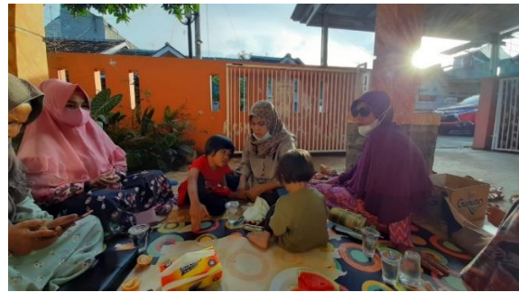
Gambar 4. Suasana pelatihan tim pelaksana 2