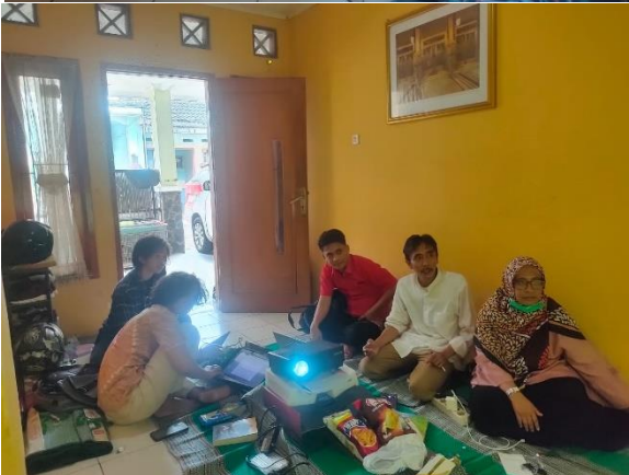
Gambar 3. Suasana pelatihan tim pelaksana 1